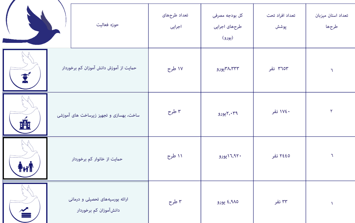
جدول ۳: تخصیص درآمدهای انجمن در سال ۲۰۲۵